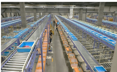
ピースソーター（店別二次検品）

入荷商品および、保管商品の検品仕分けを行い、店舗別に専用のトレイへ載せてピースソーターへ送ります。