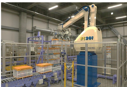
オリコン自動段積み機

オリコンを自動倉庫に一時的に格納し、店舗、商品カテゴリー、重さ別に順立てしてコンベアへ搬送します。