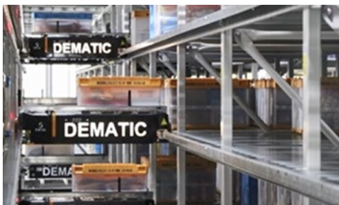
マルチシャトル（順立て出庫システム）

トレイ化ステーションで店舗別仕分けされた商品をカテゴリー別にまとめてオリコンへ収納します。