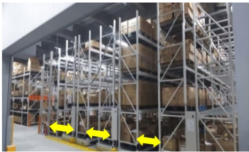
電動式パレットラック（パレット自動倉庫）