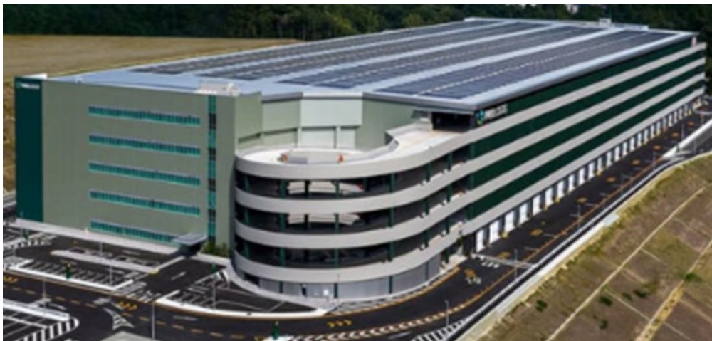
猪名川物流センター外観

また、将来的には、アークランドサカモト株式会社が運営するホームセンタームサシへ商品供給を行い、グループ全体でのシナジー創出を目指します。