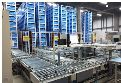
パケットスタッカークレーン（自動倉庫）