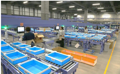
トレイ化ステーション（店別一次検品）

入荷商品および、保管商品の検品仕分けを行い、店舗別に専用のトレイへ載せてピースソーターへ送ります。